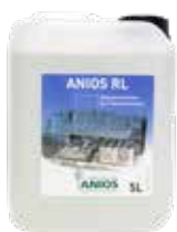
Anios RL 5 L dunk